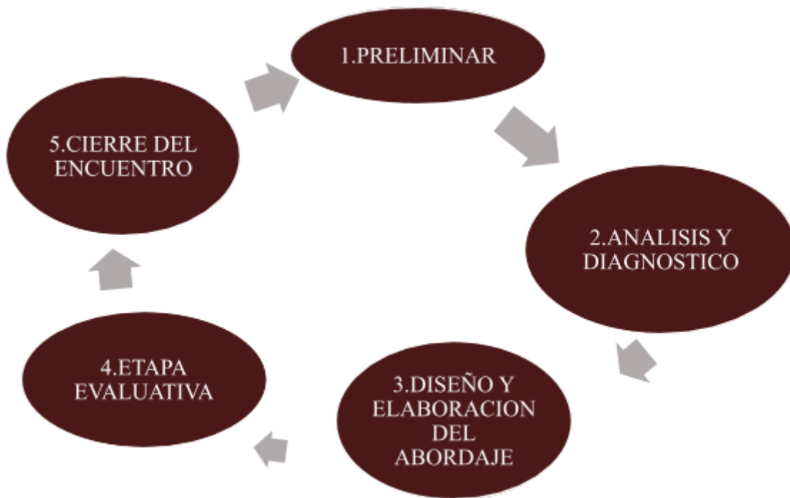
Diagrama No.2 Etapas de los Encuentros Restaurativos 12