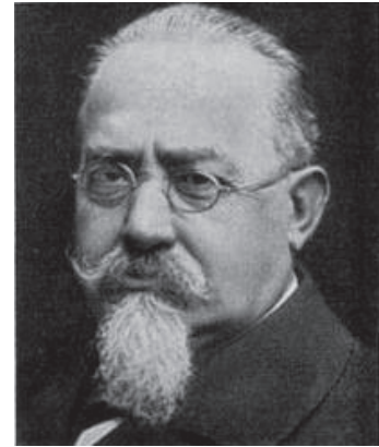
César Lombroso realizó estudios en materia de antropología criminal.

La cuestión criminal, en el amplio sentido de sus términos y que incluye por ello no únicamente al fenómeno delictivo, sino también las políticas que lo enfrentan y las normas que las regulan y sus instituciones, ha sido estudiada desde diversas disciplinas. En su inicio, cuando aparecen las ciencias sociales durante las últimas décadas del siglo XIX, la inaugura la medicina con los estudios elaborados por César Lombroso a los que denominaría estudios en materia de antropología criminal, basando las indagaciones en el positivismo filosófico que tanto auge tuvo durante la segunda mitad del siglo XIX, produciendo un conocimiento lógicamente inconsistente pero que fue aprovechado durante la crisis del Estado liberal guardián para transitar como Estado liberal intervencionista. La pregunta guía, la cual se exhibe por demás pertinente, era ¿por qué las personas dan el salto a la