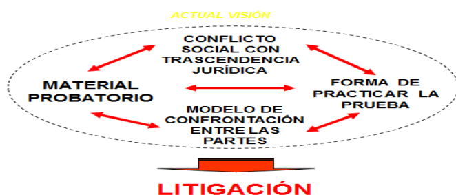
Figura n. 1: Dinámica de la Litigación

Esa lógica dialéctica nos conlleva a una lógica competitiva, base del sistema acusatorio, diseñado sobre una estructura de fuerte competencia adversarial, esto es, en la idea de que el proceso –y especialmente el juicio- promueve el enfrentamiento intenso entre las partes y apuesta a que dicho enfrentamiento arrojará la mayor cantidad de información sobre el caso, a la vez que depurará la calidad de dicha información.