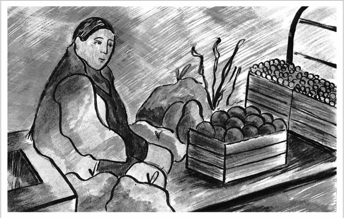
La verdulera , noviembre 2011