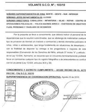
Comunicado policial interno