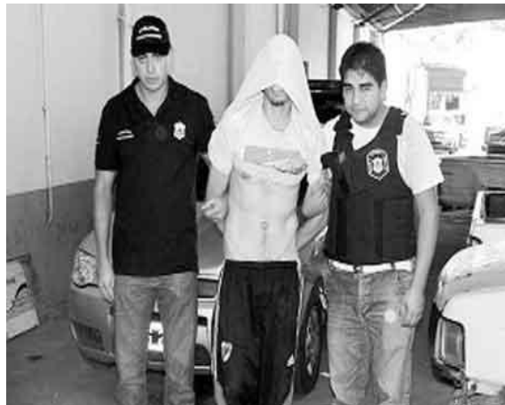
Imagen de menor RL recién detenido, es exhibido por los policías de la DDI La Plata como si fuera un trofeo. Perteneciente a la IPP 10741-11. Véase nota del diario en la que puede encontrarse la foto y la naturalización de la ejecución sumaria del compañero de causa: http://www.diariohoy.net/accion-verNota-id-137366