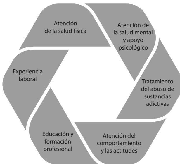
Tipos de programas de rehabilitación en las cárceles

8. Evidentemente, un régimen penitenciario integral y verdaderamente rehabilitador entraña algo más que esos tres componentes. Atender a las necesidades básicas de los reclusos, proporcionar condiciones de vida dignas, abordar las necesidades de atención sanitaria y velar por el establecimiento de relaciones constructivas entre el personal penitenciario y los reclusos que están a su cargo son requisitos probablemente más fundamentales aún, sin los cuales incluso los programas de rehabilitación más innovadores tienen pocas probabilidades de éxito. La existencia de acuerdos que garanticen la prestación de apoyo y la supervisión tras la puesta en libertad es igualmente esencial. Si faltan esos servicios se corre el riesgo de desperdiciar gran parte de los esfuerzos invertidos en la enseñanza y la formación de los reclusos en las cárceles, pues los reclusos retoman sus “viejas costumbres” delictivas. A pesar de esas limitaciones de la presente hoja de ruta, su tema —educación, formación profesional y trabajo—, aunque no sea suficiente por sí solo, es un punto de partida fundamental en todos los regímenes penitenciarios que tienen por objeto ser eficaces y cumplir las reglas y normas internacionales.